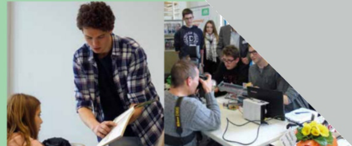
Skikurse Sportliche Wettkämpfe Instrumentalunterricht Schulfahrten Exkursionen Offene Ganztagschule Technik für Kinder MINT

Neben dem Pflichtunterricht in modern ausgestatteten Fach- und Klassenräumen werden unsere Schülerinnen und Schüler in ihrer persönlichen Entwicklung durch ein sehr vielseitiges und reichhaltiges Wahlfachangebot in Kunst, Musik, Theater und Sport gefördert. Zusätzlich begeistern praxisnahe Kurse schon früh für Technik, Naturwissenschaften und Informatik. Studienfahrten nach Sachsen und Berlin sowie ins Ausland, Skikurse der 6. und 7. Klassen ins Salzburger Land oder der Schüleraustausch mit unseren Partnerschulen in Lothringen und in Budapest bringen unseren Schülerinnen und Schülern viel Abwechslung und reichhaltige Erfahrungen.