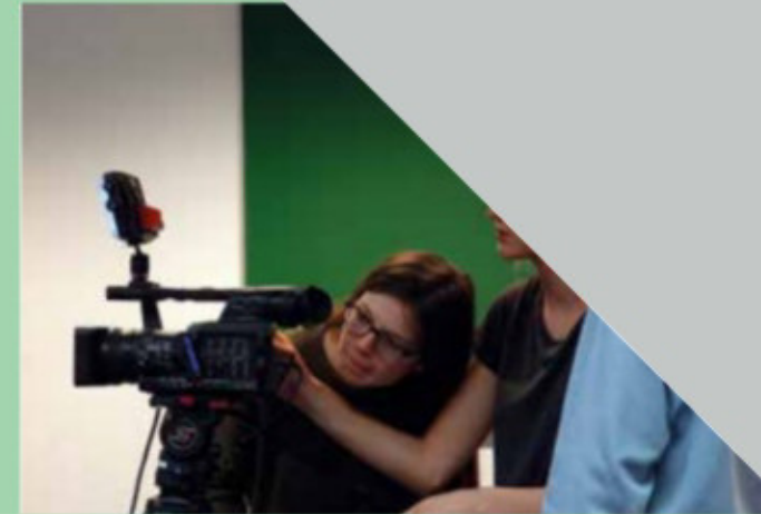
Kennenlertage im Schullandheim Tutoren Theater Lernen lernen Kniggekurs Individuelle Förderung Neue Medien und Digitale Bildung

Ein besonderes Betreuungsangebot haben wir für unsere Fünftklässler entwickelt: Tutoren aus den 10. Klassen helfen den Neuankömmlingen, sich in der ungewohnten Umgebung ihrer neuen Schule zurechtzufinden. Der Schullandheimaufenthalt der 5. Klassen bereits in der zweiten Schulwoche stärkt und fördert die Klassengemeinschaft. An unterrichtsfreien Nachmittagen wird für die Schülerinnen und Schüler der Unter- und Mittelstufe eine Hausaufgabenbetreuung angeboten.