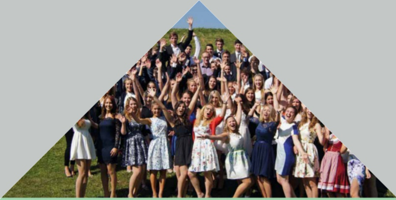
Abitur als Grundlage für Studium und Beruf

Unsere Schule zeichnet sich aus durch eine große Zahl von Veranstaltungen und Aktionen: Konzerte und gemeinsame Gottesdienste, Tanzkurse und Theateraufführungen, sportliche Wettkämpfe und Kunstausstellungen, Tag der offenen Tür und Schulfest – all dies bereichert das Leben an unserer Schule! Alljährliche Höhepunkte sind Abiturfeier und Abiturball.