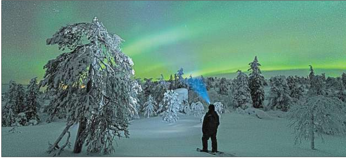
Die Natur in Finnland, hier Polarlichter über einer tief verschneiten Landschaft, trägt dazu bei, dass sich die Menschen dort besonders glücklich fühlen. Ist das von Bhutan zu toppen?

Mehrere Gründe tragen wahrscheinlich zu diesem Grundgefühl des Glückseins bei, beispielsweise die Naturverbundenheit der Finnen. Außerdem gibt es in Finnland, selbst in seiner Hauptstadt Helsinki, viele Grünflächen, die zu einer kleinen Auszeit einladen. Aber auch das „Jedermannsrecht“ trägt einen Teil zum Glück der Finnen und seiner Besucher bei. Dieses erlaubt Touristen und Einheimischen, die Natur zu nutzen, zum Beispiel durch Beeren- und Pilzernte. Eine besonders wichtige Tradition der Finnen ist das Sauna-Erlebnis und das anschließende Eisbaden, denn dadurch wird nach dem Baden der Blutkreislauf hochgeregt und es entsteht ein Hochge-