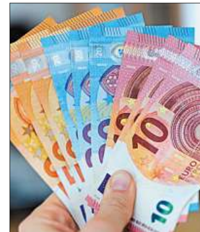
Ob Geld glücklich macht, dazu wurde vielfach geforscht.

Jan Dethley, Glücksforscher und Psychologe der Universität